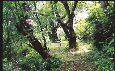
帯曲輪(おびくるわ) 带状に城を囲んでいる二段の帯曲輪。上の帯曲輪、下の帯曲輪には樹齢80余年の桜・染井吉野を見ることができます。