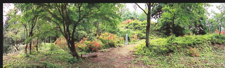
三ノ丸跡 榊沢城最大の曲輪で五段になっています。写真は中段の中央部です。