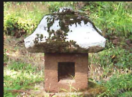
胎衣塚(えなつか) 景勝公の胎衣を納めたと伝えられており、城の中腹に安置され、往時から「安産の宮」として信仰を集めています。