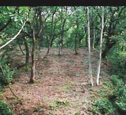
西ノ丸跡 往時の雰囲気を楽しめる憩いの広場。南側大斜面には上下二段の横堀土塁がめぐらされています。

龍澤寺 上杉謙信公、景勝公ゆかりの龍澤寺は、榊沢城跡の登り口脇にあります。上杉景勝公生誕之地碑や仙桃院(謙信公の姉)のお花畑跡、そして謙信公御朱印状、仙桃院寄進の文殊菩薩像も拝観できます。