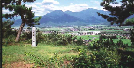
本丸跡 上田庄が一望できます。東北に坂戸城跡、正面に仙石城跡を望み、手前約500m先が古刹・上田山大儀寺跡です。