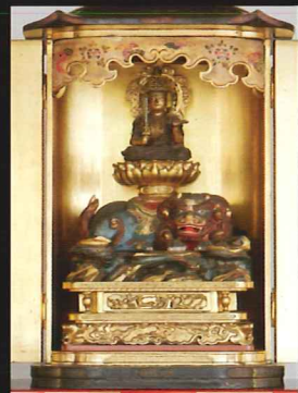
厨子入り文殊菩薩像[あやの文殊]