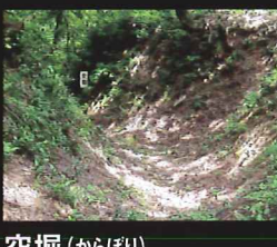
空堀(からぼり) 城跡のいたる所で見られ、往時を偲ばせています。